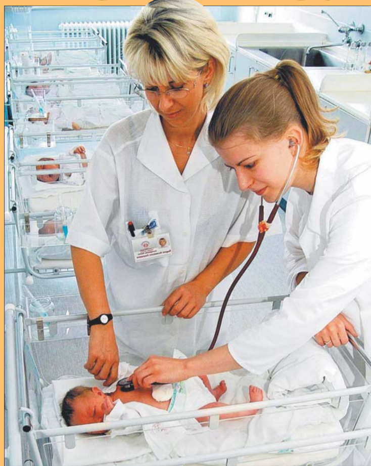
Átlagosan 4 nap után hazavihetik a gyermeküket a szülők

hárról elmondható, hogy nem csak hogy akadálymentes, de egyike az országban azoknak az intézményeknek, ahol a legtöbb egy- és kétágyas kórterem található. – De ha egy másik példát nézünk, például a daganatos